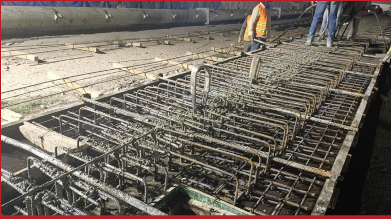
Figura 3. Colado de elementos prefabricados HOLPRE. Atitalaquia, Estado de Hidalgo, México.

La Tabla 2 muestra algunos resultados de los concretos elaborados.