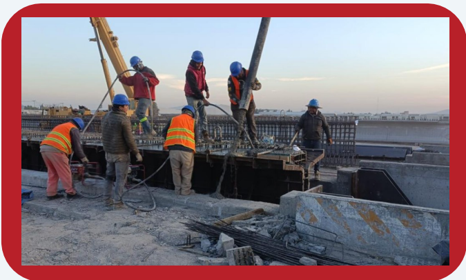
Figura 2. Cimbrado del elemento, formando el encamisado

Recordemos que la industria cementera es la responsable de generar entre el 5 al 8 % de las emisiones de CO 2 a nivel global 12 . En algunos casos, el uso de materiales cementicios suplementarios como las puzolanas, cenizas volantes, escorias granuladas de alto horno, etc. pueden coadyuvar a lograr estos objetivos.