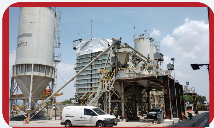
Figura 1. Planta para elaboración de elementos prefabricados HOLPRE. Atitalaquia Estado de Hidalgo, México